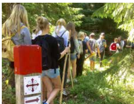
Pilgrimskonfirmander på vandring.

I samhället var kyrkan och missionshuset en naturlig del. En plats att tillbe och lära känna Gud, men också en plats för gemenskap och omsorg. Det var där en av de anställda som tillsammans med en lärare startade scoutrörelsen. De tog över